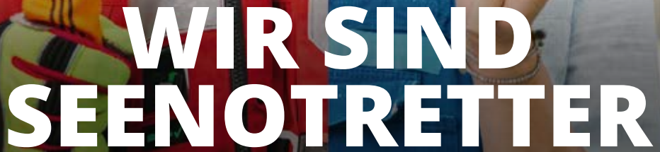
Sonja DIY-Expertin und Spenderin, Herford